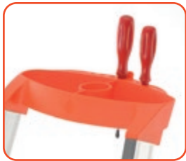
Comoda vaschetta porta-oggetti Large useful tooltray