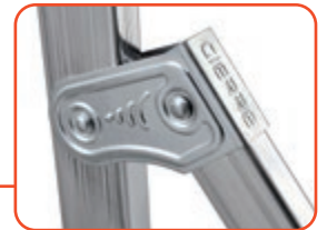
Articolazione in acciaio zincato con nervature di rinforzo Steel hinge, reinforced