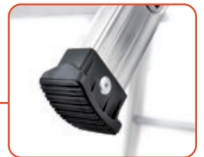
Piedini antiscivolo zigrinati, fissati ai montanti, massima aderenza al terreno Non-slip knurled feet, blocked to the upright, high grip