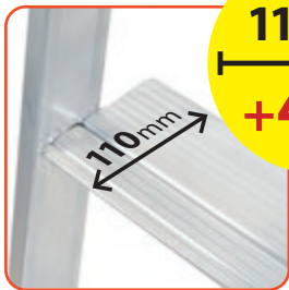
Gradino zigrinato da 110 mm, più largo, più comodo, con profilo anti-taglio, fissato tramite ribordatura 110 mm with knurled step, with rounded profile, great comfort during use