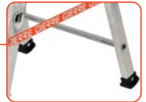
Struttura solida in alluminio con rinforzi posteriori per una maggiore stabilità e sicurezza Solid structure, made of aluminium, reinforced on the back side